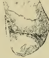
FIG. 2. — Détail de la bouche d'un exemplaire de la même localité.

La coquille est subcylindrique, à peine conique dans le voisinage de la bouche et pendant les quatre ou cinq derniers tours. Elle devient ensuite nettement conique. L'extrémité supérieure, mal conservée, est acuminée, mais cependant assez obtuse.