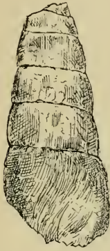
FIG. 1. — Amphidromus Serresi Math. Exemple de la Choi- sity près Aramon (Gard).

Coquille de grande taille, analogue à celle de B. Hopei , allongée cylindrique, se rétrécissant très graduellement vers le sommet, sans présenter de renflement à la hauteur de l'avant-dernier tour. Le nombre des tours est difficile à indiquer, peut-être en existe-t-il 10 à 12.